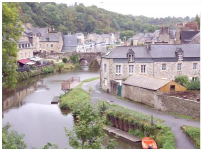
El río Rance en Dinan