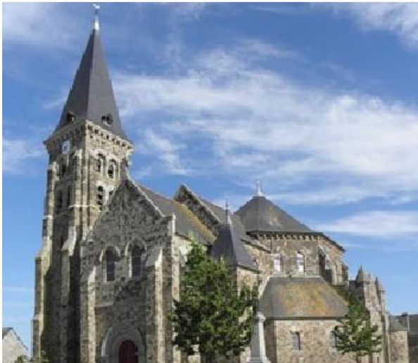
Iglesia de Saint-Méen-et-Sainte-Croix en La Fresnais

Puerta de entrada a los demás países de Europa y del mundo a través de sus puertos ( Nantes, Lorient, Brest ), Bretaña parece emerger de las aguas del océano Atlántico que se estrellan sobre ella durante las tormentas del equinoccio.