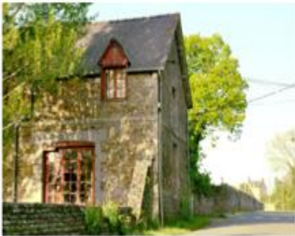
Village Le Tronchet

No iremos al Mont-Saint-Michel porque está demasiado concurrido: 3 millones de visitantes al año, la mitad de los cuales visitan la abadía. Pero si su grupo pasa por la concatedral de Dol-de-Bretagne, que está a 25 km, vaya a admirar este edificio de puro estilo gótico. El campo al sur de la costa tiene mucho que ofrecer, como la abadía de Tronchet, los bosques de Coëtquen y Villecartier. Sin olvidar los lagos y estanques abiertos al baño, como el Etang de Bétineuc, cerca de Evran, o el Etang du Boulet, cerca de Combourg.