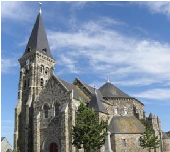
Iglesia de Saint-Méen-et-Sainte-Croix en La Fresnais

Puerta de entrada a los demás países de Europa y del mundo a través de sus puertos ( Nantes, Lorient, Brest ), Bretaña parece emerger de las aguas del océano Atlántico que baten sobre ella durante las tormentas del equinoccio otoñal.